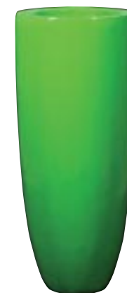
J1018-S1 [ Seychellen ] H 120 Ø 50