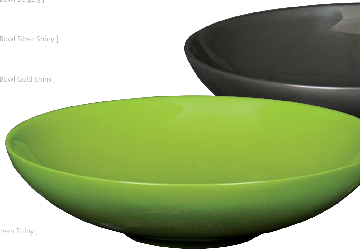
Q1002-S1 [ Spring Bowl Green Shiny ] H 8 Ø 33