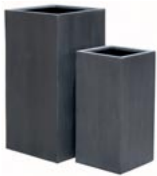
E1016-S2 [ Bouvy set 2 ] H 80-60 L/W 40-30