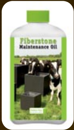
Fiberstone Maintenance Oil