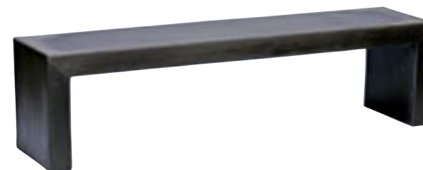
E1029 [ Bench ] H 45 L 174 W 40