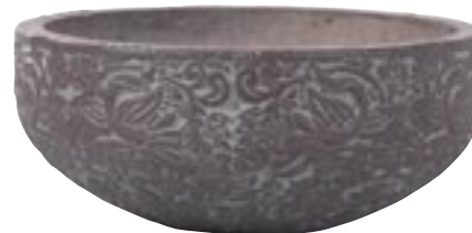
G1005-S3 [ Brussel ] H 29-23-17 Ø 70-50-40