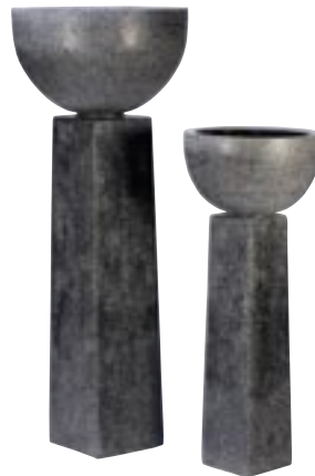
E1055-S2 [ Pillar ] H 113-85 L/W 30-22