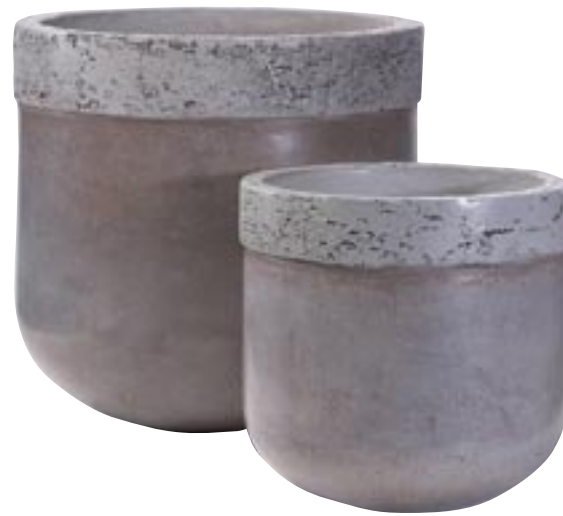
G1024-S3 [ Rim pot ] H 36-26-20 Ø 37-26-20