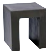
E1019 [ Chair ] H 45 L/W 40 x 40