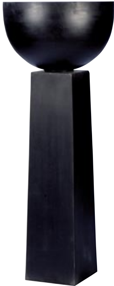
E1055-S2 [ Pillar ] H 115-86 L/W 30 - 22