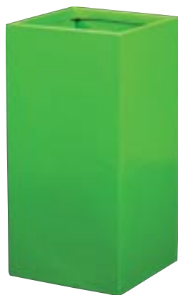
J1011-S1 [ Sardinië ] J1012-S1 [ Sardinië ] H 60 L/W 30 H 80 L/W 40