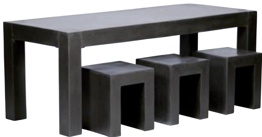
E1020-S1-01 [ Table L ] H 75 L 200 W 80