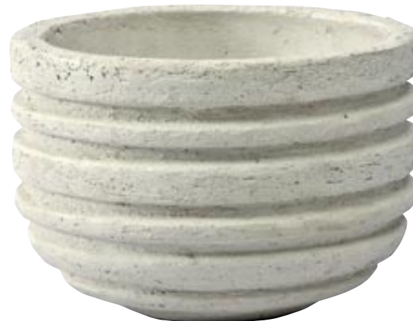
G1022-S2 [ Stockholm chalk ] H 23-15 Ø 30-20 G1023-S2 [ Stockholm chalk ] H 30-23 Ø 40-30