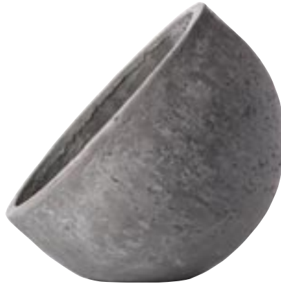
G1017-S1 [ Moskou ] H 38 Ø 40