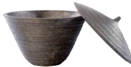
G1009-S1 / G1010-S1 [ Lissabon ] H 24 Ø 38 / H 31 Ø 50