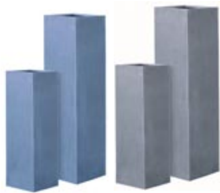
E1005-S1 [ Yang ] H 100 L/W 35-35 E1006-S1 [ Ying ] H 150 L/W 40-40