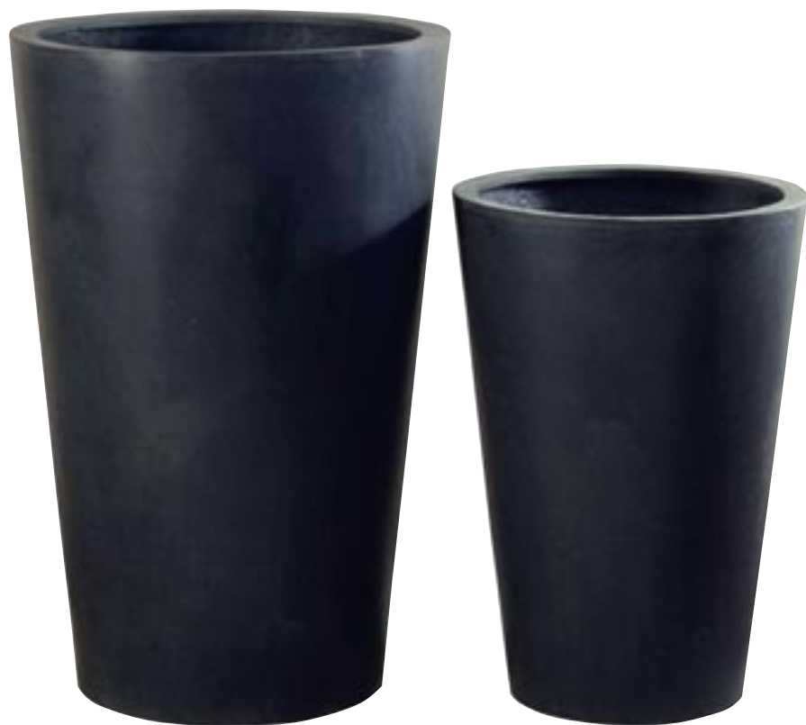
E1010-S2 [ Belle ] H 90-70 Ø 60-47