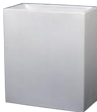
J1013-S1 [ Bonaire ] J1014-S1 [ Bonaire ] H/L/W 90-80-40 H/L/W 70-60-30