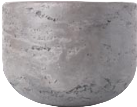
G1018-S2 [ Madrid ] H 23-15 Ø 30-20 G1019-S2 [ Madrid ] H 30-23 Ø 40-30