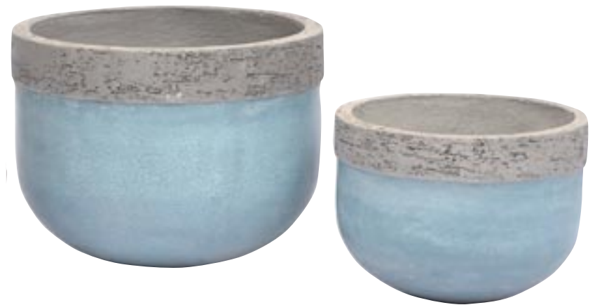
G1026-S2 [ Rim low ] H 23-15 Ø 30-20

► Available in ice blue, ice brown and ice white. Indoor and outdoor.