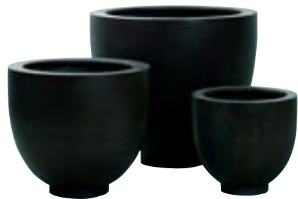
E1030-S3 [ Tim ] H 43-32-25 Ø 46-35-26