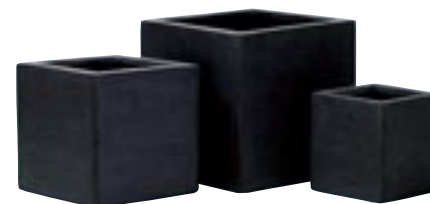
E1035-S3 [ Fleur ] H 25-20-15 L/W 25-20-15