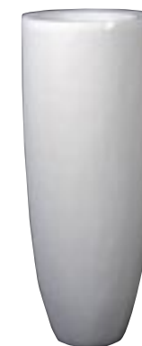
J1017-S1 [ Aruba ] H 150 Ø 50

► Available in white (S01) and applegreen (S11). Indoor and outdoor.