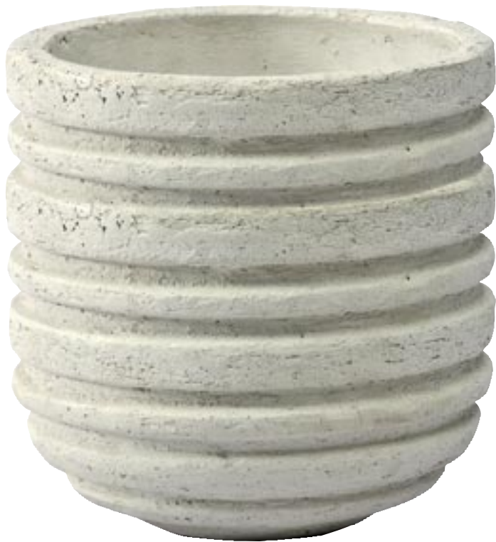
G1020-S3 [ Luxemburg chalk ] H 40-30-20 Ø 40-30-20