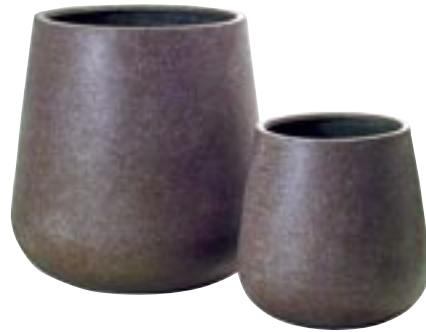
E1042-S [Pax] H 67-46 Ø 66-44