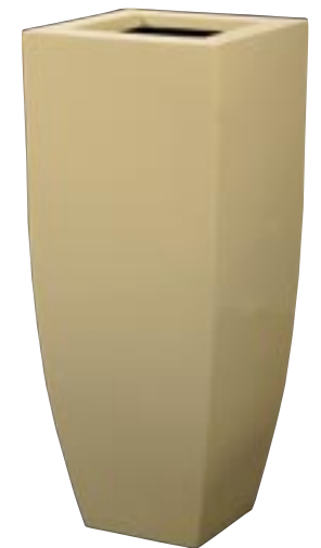
Q1001-S1 [ Spring Vase Yellow 1 ]