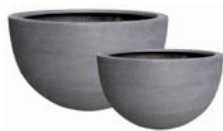
E1065 [ Bowl ] H 38 Ø 60 E1066 [ Bowl ] H 28 Ø 45 [ set 2 ]