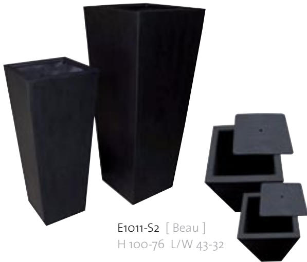
E1011-S2 [Beau] H 100-76 L/W 43-32