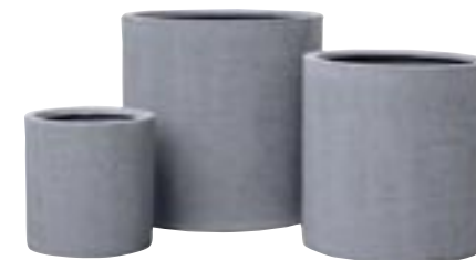
E1014-S3 [ Max ] H 50-43-30 Ø 51-43-29,5