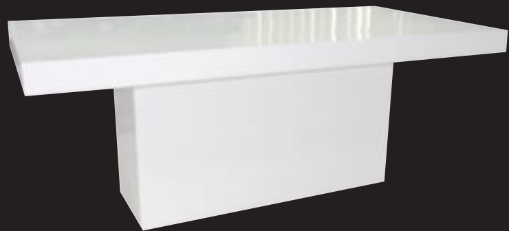
E1068 [ Table ] H 77 L 200 W 100

► Available in shiny white (S01). Indoor and outdoor.