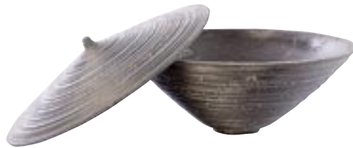
G1007-S1 / G1008-S1 [ Kopenhagen ] H 15 Ø 38 / H 19 Ø 48