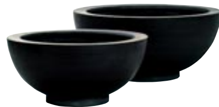
E1031-S2 [ Maud ] H 22-18 Ø 49-40