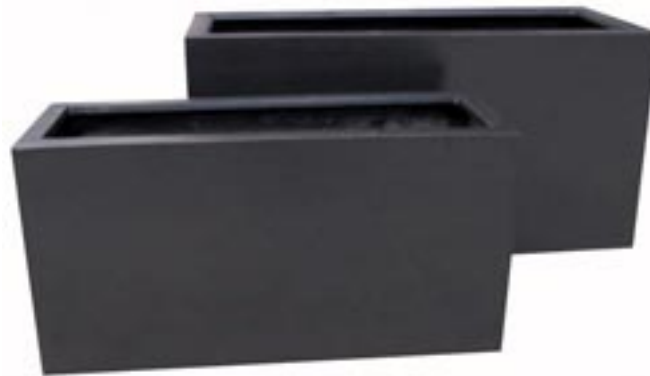
E1008-S2 [ Jort set van 2 ] H 50-40 L 100/80 W 40/30

► Available in black (01), grey (03) and terrazzo brown (09).