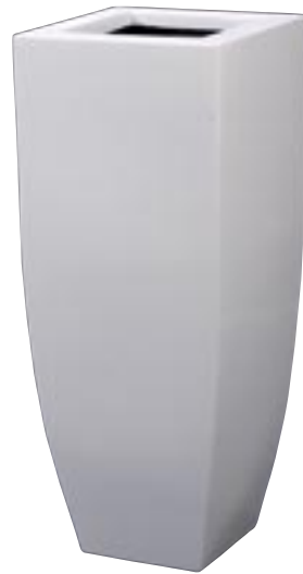
Q1001-S1 [ Spring Vase White Shiny ]