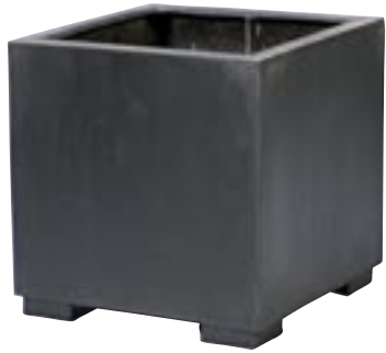
E1024-S1 [ Jumbo S ] H 50 L/W 50-50