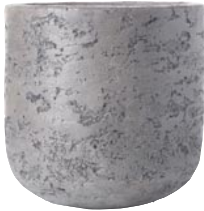
G1011-S2 [ Londen ] H 30-20 Ø 30-20 G1012-S2 [ Londen ] H 40-30 Ø 40-30 G1013-S2 [ Londen ] H 70-55 Ø 71-56