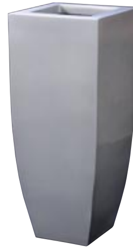
Q1001-S1 [ Spring Vase Warm Grey 1 ]