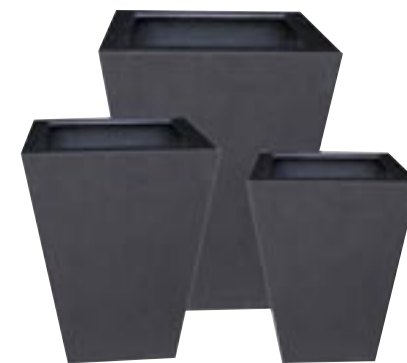
E1012-S3 [ Thom ] H 90-68-50 L/W 66-50-37