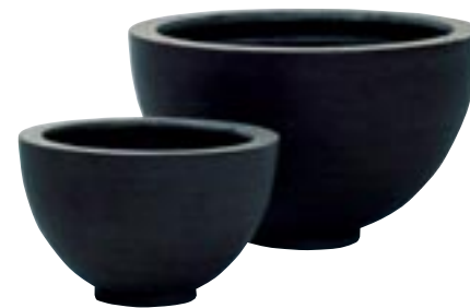
E1032-S2 [ Peter ] H 18-13 Ø 30-20