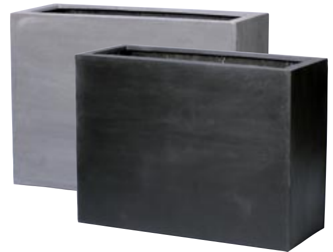
E1009-S1 [ Jort L ] E1057-S1 [ Jort XL ] H 72 L 95 W 38 H 100 L 100 W 45