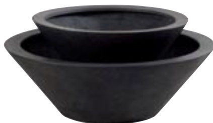
E1015-S2 [ Don ] H 27-21 Ø 80-59