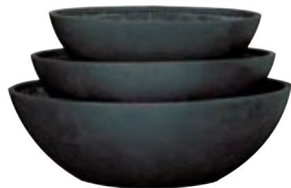
E1037-S3 [ Drax ] H 27-23-20 Ø 79-40,5 / 68-34 / 59-28