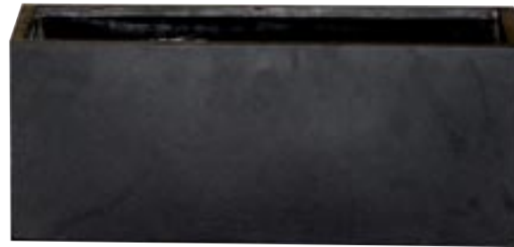
E1066-S1 [ Jort S ] H 40 L 80 W 30