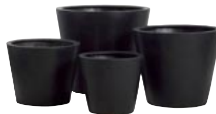
E1004-S4 [ Bucket ] H 60-50-40-35 Ø 70-58-50-40