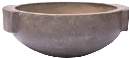
G1006-S3 [ Amsterdam ] H 29-23-17 Ø 70-55-40 available in kaki and pink