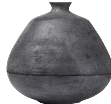
G1021-S1 [ Oslo ] H 41 Ø 44