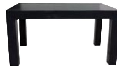
E1013-S1 [ Table M ] H 75 L 140 W 90