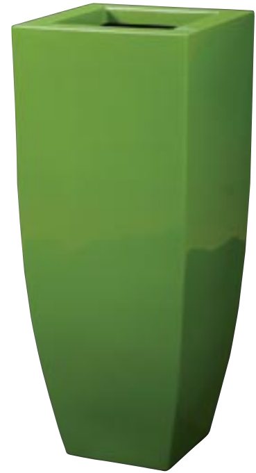
Q1001-S1 [ Spring Vase Green Shiny ]