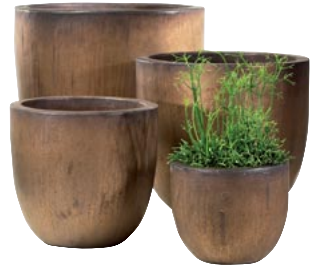
G1028-S2-S4 [ Jakarta ] H 30-20 Ø 32-24 available in bronze