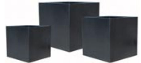
E1002-S3 [ Block set 3 ] H 50-40-30 L/W 50-40-30

► Available in black (01), grey (03) and terrazzo brown (09). Indoor and outdoor.