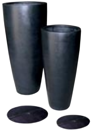
E1043-S2 [Dax] H 100-80 Ø 47-37