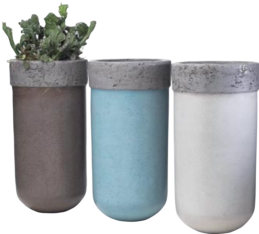
G1025-S2 [ Rim vase ] H 60-42 Ø 30-22