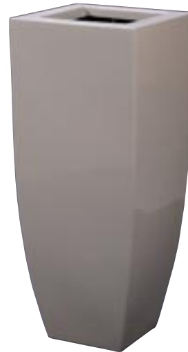
Q1001-S1 [ Spring Vase Warm Grey 2 ]