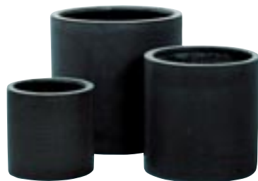
E1033-S3 [ Puk ] H 25-20-15 Ø 25-20-15