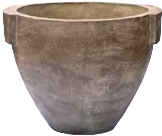
G1003-S3 [ Rome ] H 68-52-37 Ø 81-61-45 available in kaki and pink