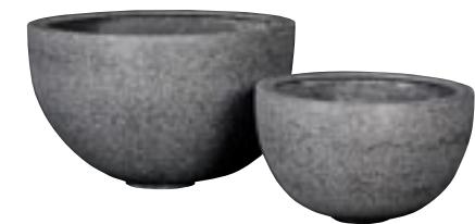
E1054-S2 [ Bowl black and white ] H 38-28 Ø 60-45