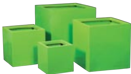
J1009-S4 [ Malediven ] H 60-50-40-30 L/W 60-50-40-30