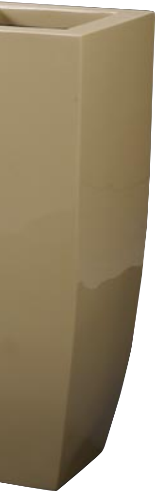
Q1001-S1 [ Spring Vase Beige 3 ]