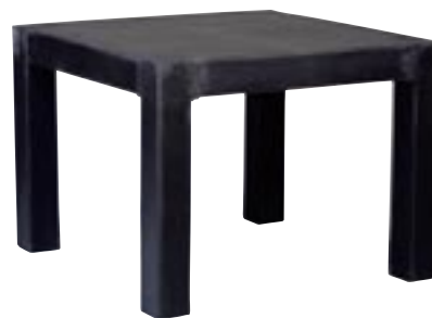
E1007-S1 [ Table S ] H 75 L/W 100 x 100