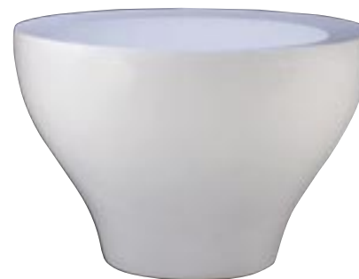
J1015-S3 [ Curaçao ] J1019-S2 H 75-51-37 H 51-37 Ø 110-81-56 Ø 81-56