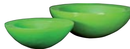
J1016-S2 [ Mauritius ] H 33-30 Ø 95-70