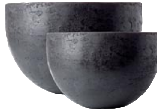
G1015-S2 [ Berlijn ] H 40-30 Ø 60-46 G1016-S2 [ Berlijn ] H 25,5-20 Ø 40-30