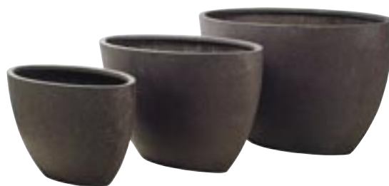
E1038-S3 [ Dorant ] H 50-44-37,5 Ø 102-44 / 89-38 / 75-32