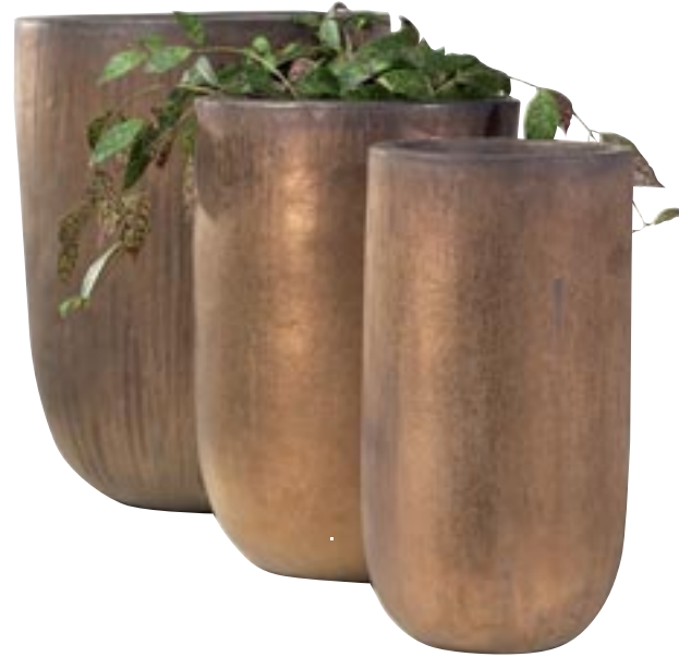
G1027-S2 [ Bangkok ] H 49-45 Ø 32-23 available in bronze