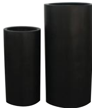
E1018-S2 [ Klax ] H 80-60 Ø 40-30