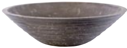
G1001-S3 [ Wenen ] H 18-16-12 Ø 65-55-45