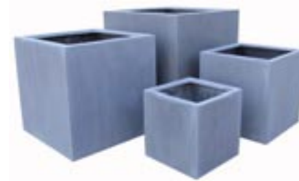
E1003-S4 [ Block set 4 ] H 60-50-40-30 L/W 60-50-40-30