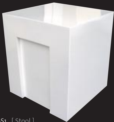
E1067-S1 [ Stool ] H 45 L 45 W 40