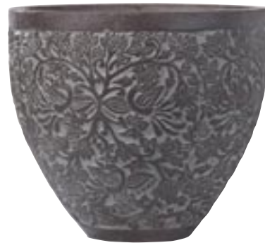
G1002-S2 [ Athene ] H 70-55 Ø 81-61