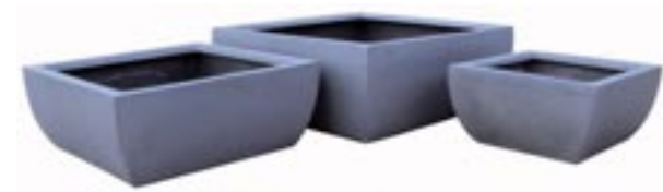
E1001-S3 [ Sphere ] H 19-17-15 L/W 50-40-30