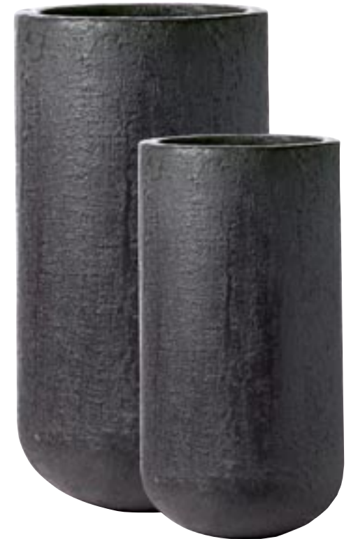
G1014-S2 [ Parijs ] H 80-60 Ø 41-30

► Available in black, grey and chalk. Indoor and outdoor.