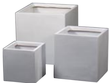
J1010-S3 [ St. Maarten ] H 50-40-30 L/W 50-40-30