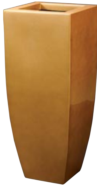
Q1001-S1 [ Spring Vase Gold Shiny ]