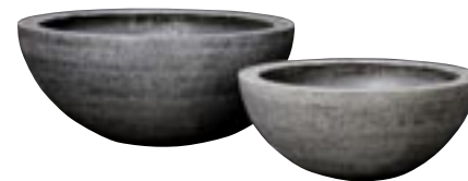
E1053-S2 [ Bowl L ] H 30-40 Ø 89-69