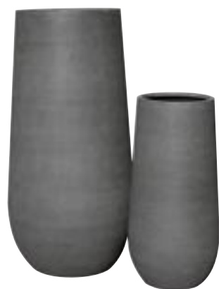
E1036-S2 [ Nax ] H 101-70 Ø 50-35