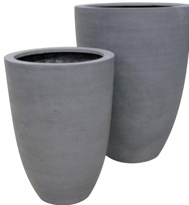
E1051-S2 [ Ben ] H 72-55 Ø 52-40

► Available in black (01), grey (03) and terrazzo brown (09). Indoor and outdoor.