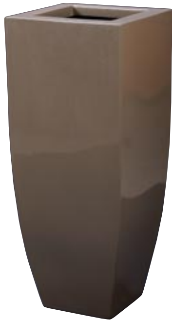
Q1001-S1 [ Spring Vase Silver Shiny ]