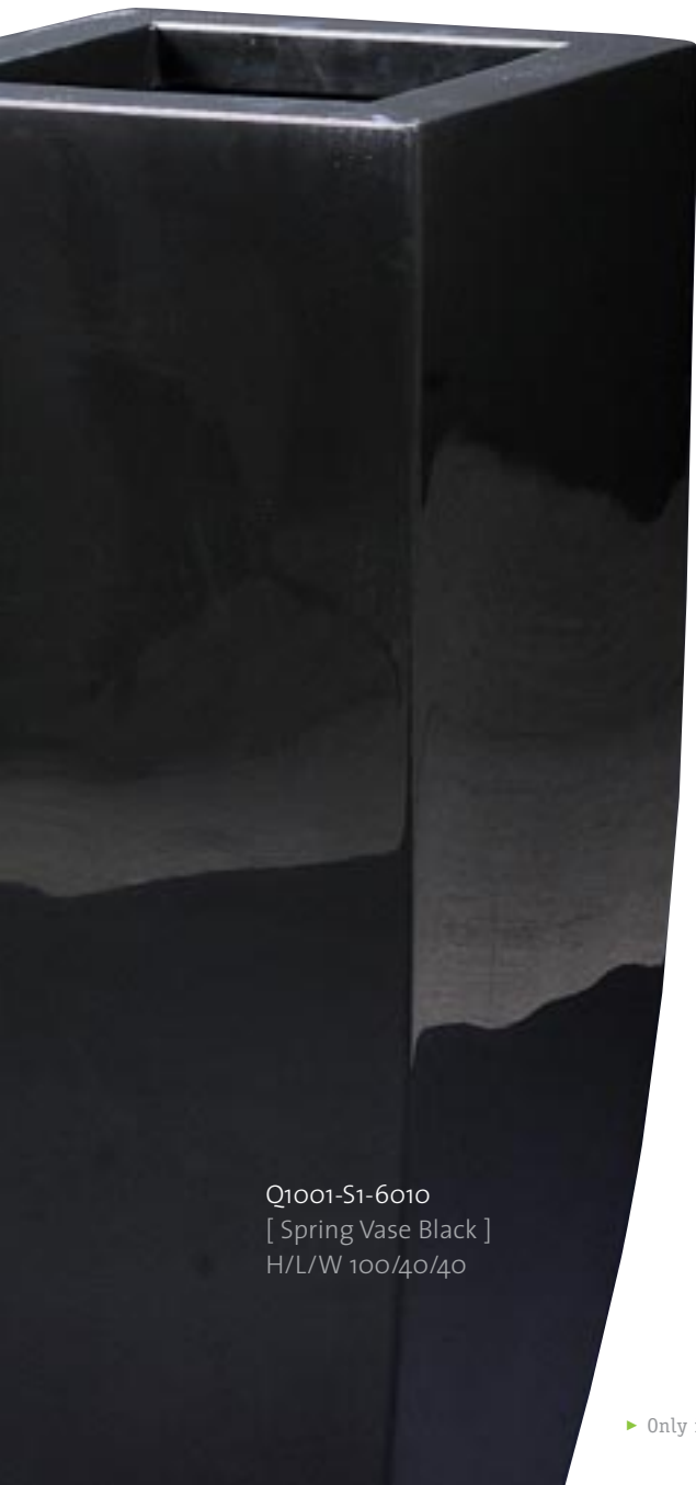
Q1001-S1-6010 [ Spring Vase Black ] H/L/W 100/40/40